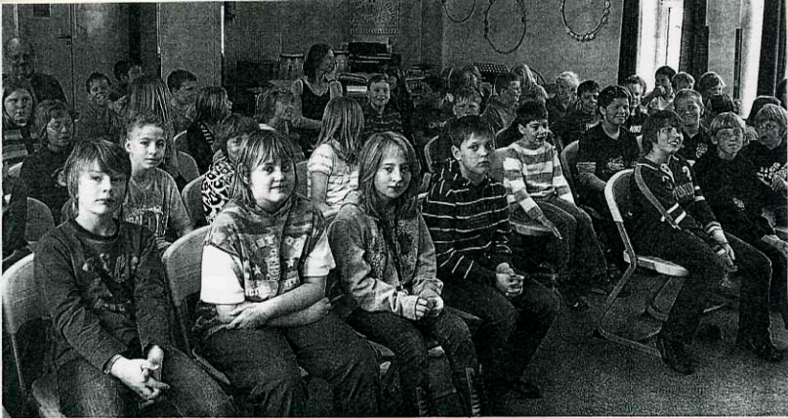
Die Sittenser Viertklässler amüsierten sich bei der Vorstellung, mit dem Kaiman im Silbersee baden zu gehen.